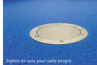
Siphon de sols pour salle propre

Sols MIPOLAM BIOCONTROL & BIOCONTROL PERFORMANCE spécialement conçus pour environnements contrôlés et salles propres. Coloris choisis en fonction du classement particulière et microbiologique des zones concernées.