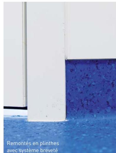
Remontés en plinthes avec système breveté CLEAN CORNER pour salles propres